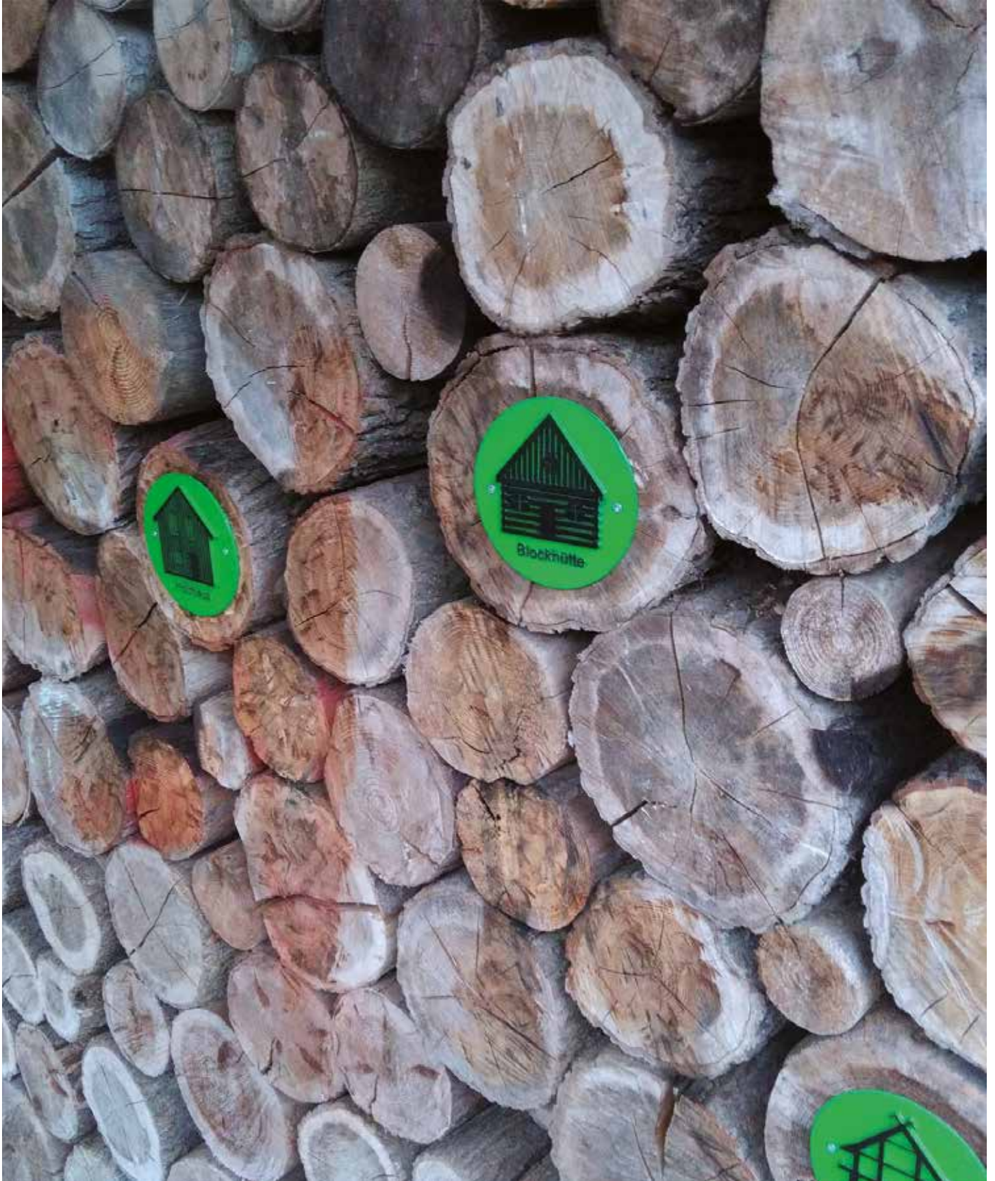
A Stuttgartban található Erdei Oktatási Központban (Németországban) taktilis jelek segítik a vak és gyengénlátó embereket a tájékozódásban.