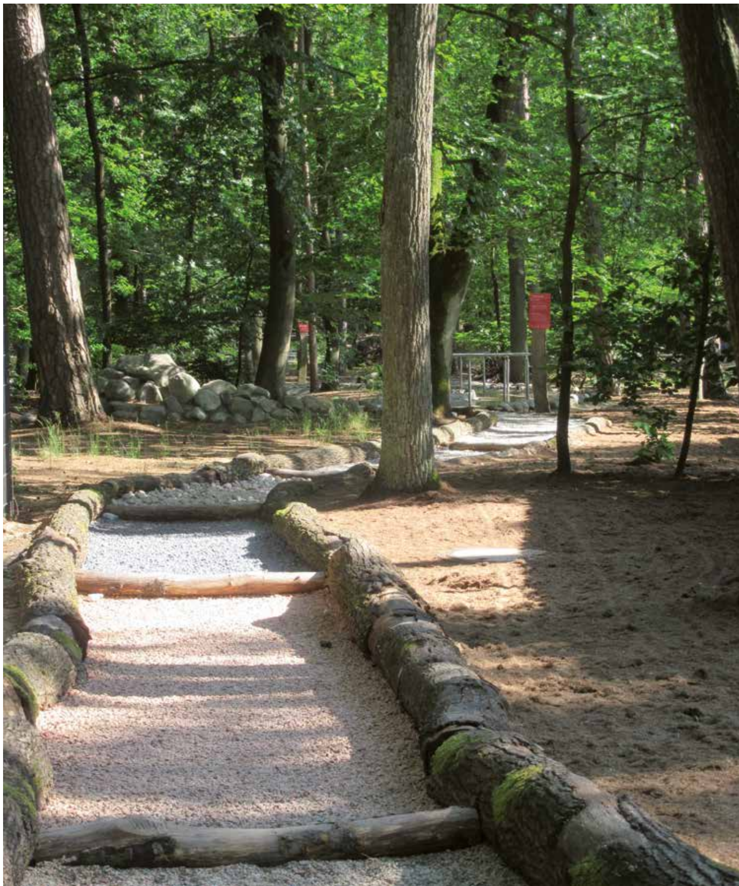
A Beelitz-Heilstättenben található mezítlás parkban a látogatók az érzékszerveik segítségével ismerhetik meg a természetet.