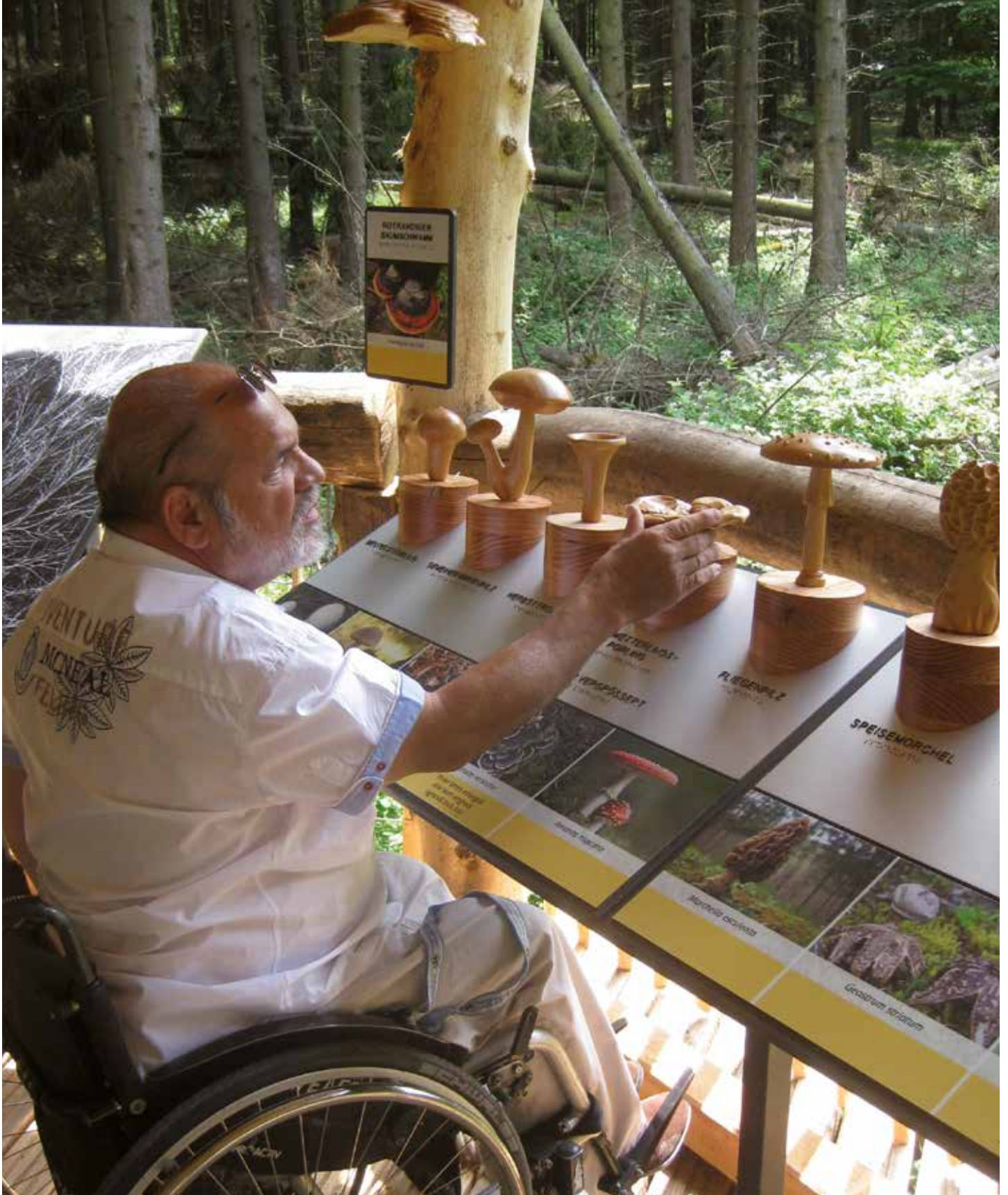
Az Eifel Nemzeti Parkban található „Vad tanösvény“ elnevezésű túraútvonalon akadálymentes hozzáférést biztosítanak a látogatóknak a természet megismeréséhez.