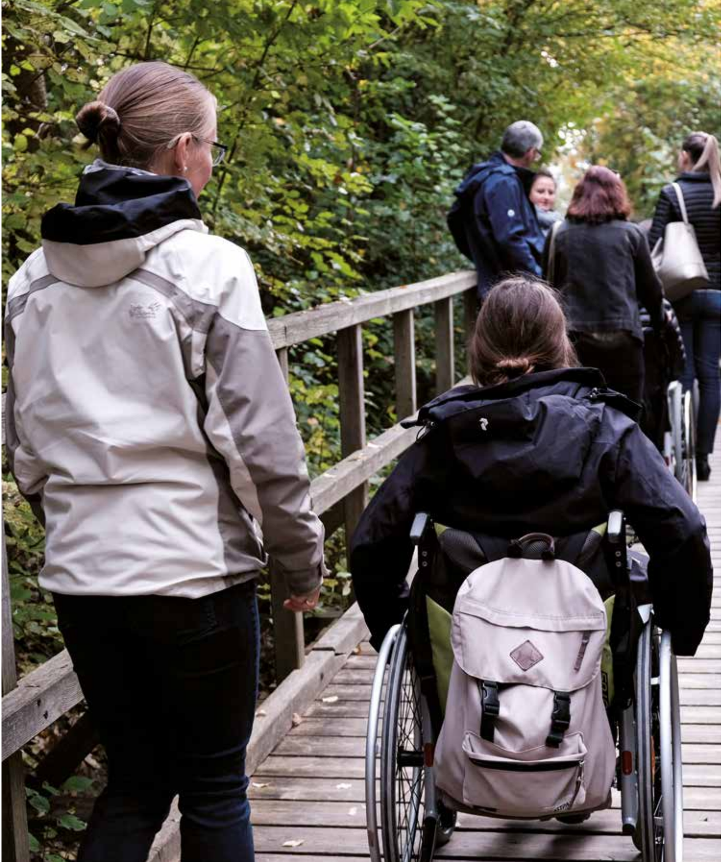
A „Természet korlátok nélkül“ projekt csapata Ausztriában, a Donauauen Nemzeti Parkban tartott figyelemfelhívó workshopon.