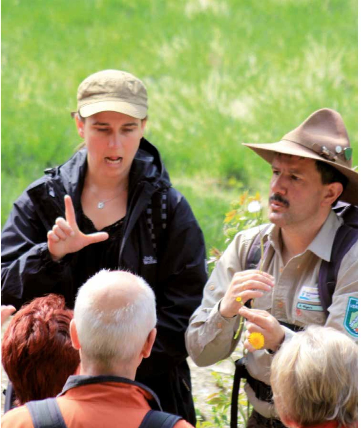
Régóta magától értetődő: Jelnyelvi tolmácsolás az Eifel Nemzeti Parkban található „Wild Kermeter“ természetvédelmi területen. A jelnyelvi tolmács lefordítja a túravezető által közölt információkat a hallássérült látogatók számára.